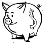
私校退撫儲金(新制)-自主投資 111年度1月~9月期間報酬率

3. 資料來源：財團法人中華民國私立學校教職員退休撫卹離職資遣儲金管理委員會網站公告資料。